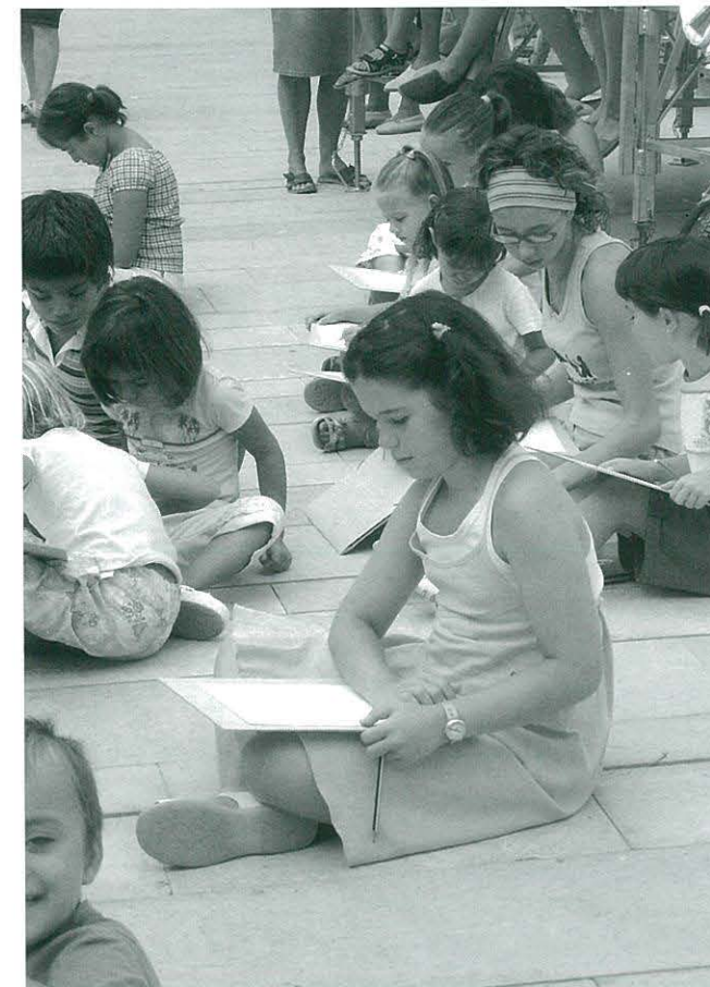
Participants al Concurs Literari Sant Jordi

El passat dia 13 d'abril, molts xiquets i xiquetes del CEIP "Ramón y Cajal", van redactar el seus escrits per participar en el concurs literari de Sant Jordi d'enguany. El tema era " La vida a l'any 2050 ". Es veu que, com acabaven de tornar de les vacances de Setmana Santa, estaven tots molt inspirats i van sortir unes redaccions molt boniques. Ara li toca al Jurat decidir a quines concedeix els premis... Segur que ho tindrà molt difícil! Tots els participants van rebre un petit obsequi.