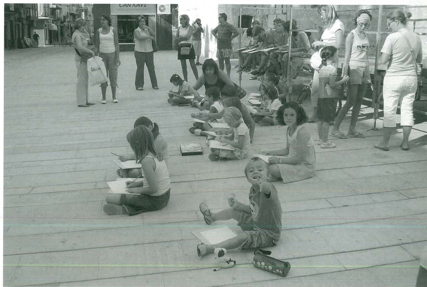
Participants al Concurs Literari Sant Jordi