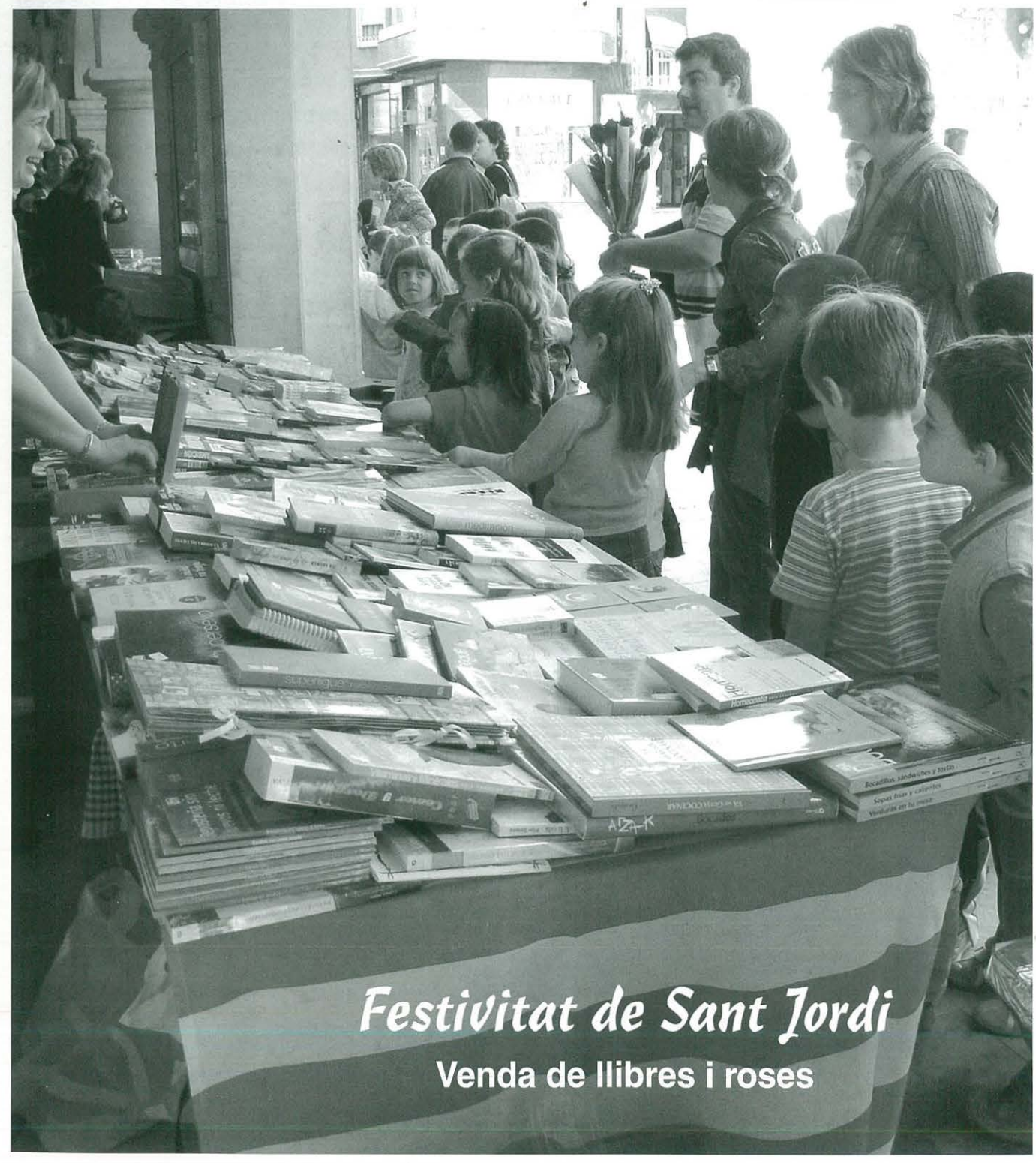
Festivitat de Sant Jordi Venda de llibres i roses