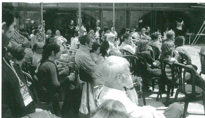
Assistents a l'acte de cloenda de la mostra de teatre