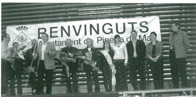
Acte de cloenda de la mostra, amb l'assistència d'autoritats i representants de "Focus Teatre", entre ells l'actor Joan Pera

PROGRAMES, REVISTES, TARIFES DE PREUS, CATÀLEGS, ALBARANS, FACTURES I TOT TIPUS D'IMPRESSOS COMERCIALS I PUBLICITARIS. PAPER FOTOCOPIADORA