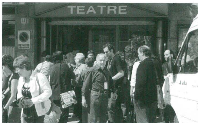
Sortida del teatre en un descans

El Grup de Teatre del CCR participa enguany també en aquesta concentració de grups teatrals amateurs. Es celebrà durant el primer cap de setmana del mes de maig a Pineda de Mar. Hi ha representacions amb titelles, amb dances, modernes i clàssiques, en català i en castellà... I hi participen grups de molts llocs diferents.