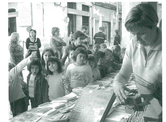
Visita dels més joves a la paradeta del CCR

El 23 d'abril ja se sap: no pot faltar de cap manera la paradeta del CCR a la plaça de l'església. Així que enguany els membres de la Junta van preparar molts llibres, de temes diversos, adreçats a públics de totes les edats, i moltes